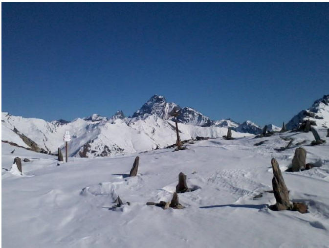
Le Viso depuis le col du Longet