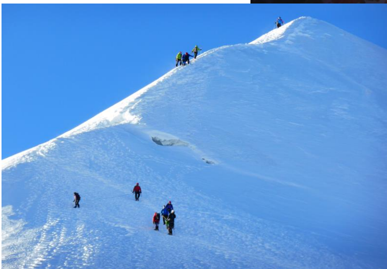
lever du jour sur le Mont-Blanc et l'arête des bosses..