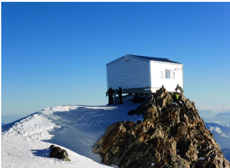
les refuges de tête rousse , du goûter et l'abri Vallot...