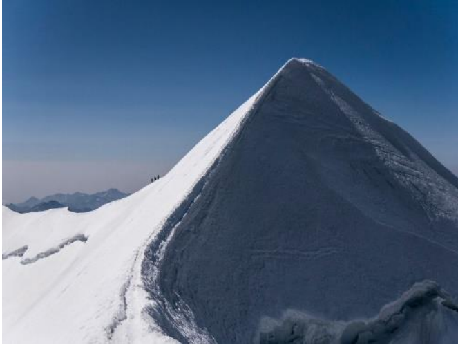
Arête du castor. Et sommet.