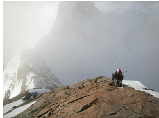
refuge margherita au fond et zumsteinspitze en premier plan . Sur l'arête menant au sommet du mont rose.