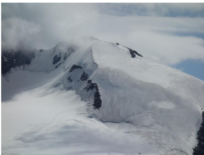
traversée du nez du lyskam